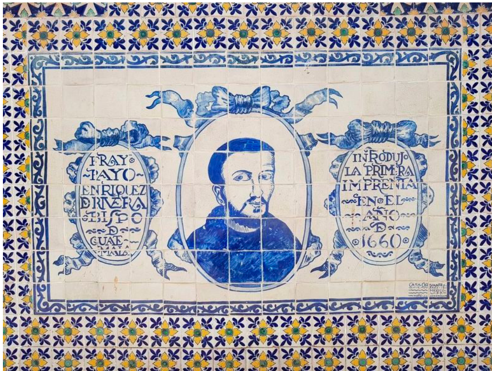
Fotografía por J. Makali Bruton, 17 de marzo de 2018

Al final del informe, Fray Payo retoma lo que había expuesto al principio de su carta, señalando que las universidades eran «el muro más fuerte de la religión». Fray Payo dio el ejemplo de la universidad de Granada, la cual fue fundada para combatir las herejías en aquel reino. La mención de Granada, confirma la reflexión de Enrique González sobre