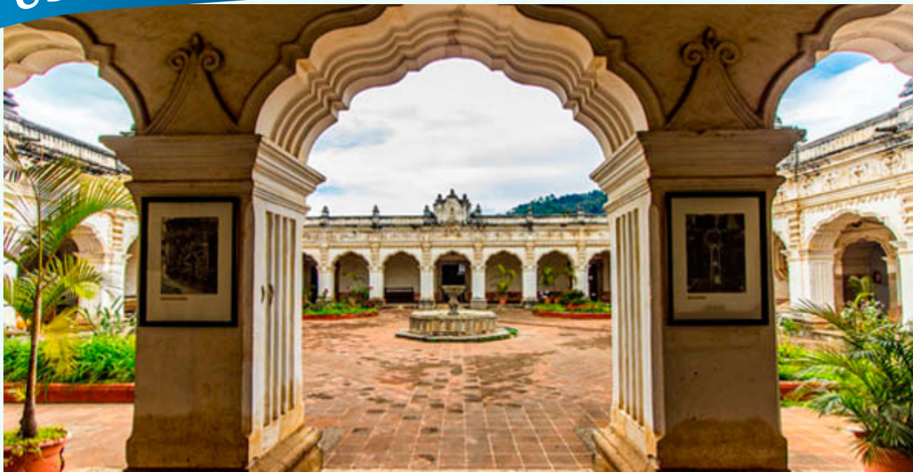
Museo de Arte Colonial Antigua Guatemala, lugar donde funcionó la Universidad de San Carlos. (dominio Público).