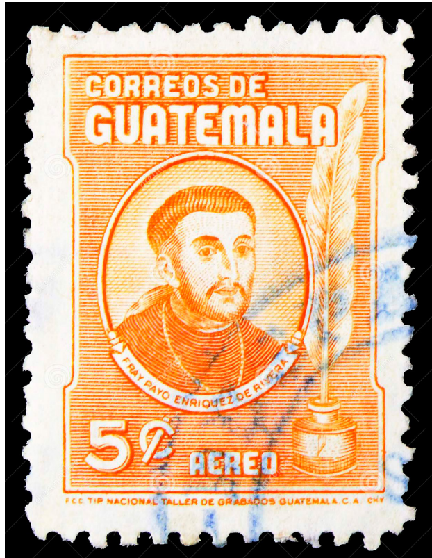
Sello postal dedicado a Fray Payo Enríquez de Rivera, impreso en 1964