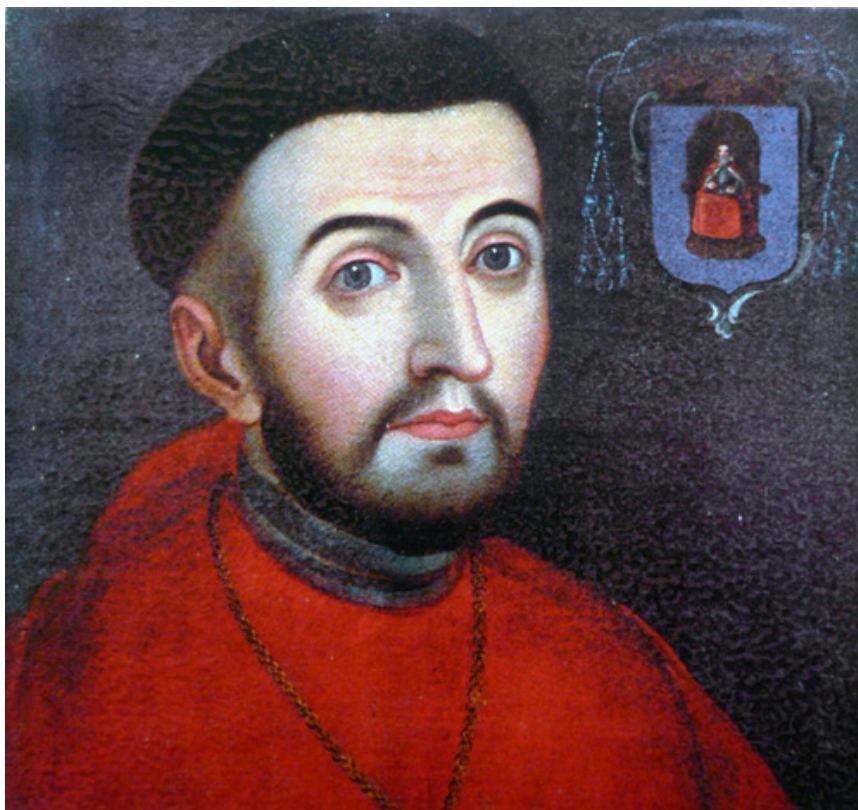
Fray Payo Enríquez de Rivera, anónimo (1800-1830)